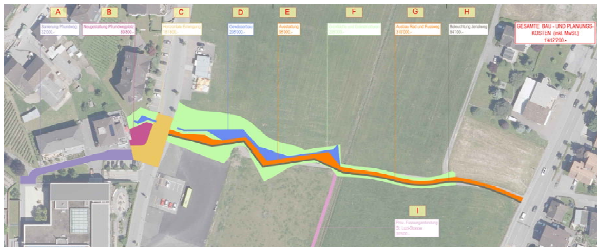
Abbildung: Projektperimeter mit Kostenelemente

2 Bei diesem Betrag wurde die Variante 2 (Beleuchtungspoller) berücksichtigt.