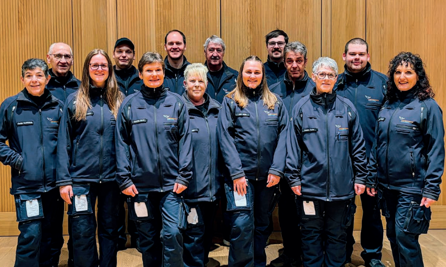
Notfalltreffpunkt-Einsatzteam des Gemeindefschutzes Eschen-Nendeln.