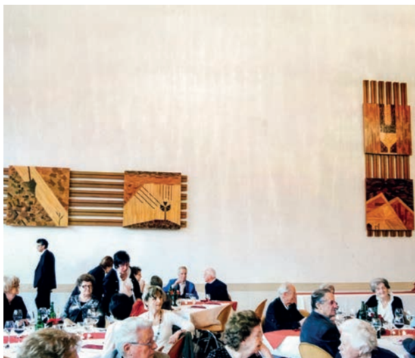
Wandschmuck im Gemeindesaal Eschen (Aufnahme aus dem Jahr 2011).