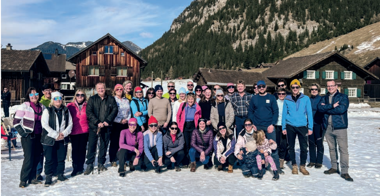
Rund 40 Sportbegeisterte aus der Gemeinde nahmen am Anlass teil, welcher bei schönem Wetter durchgeführt wurde.