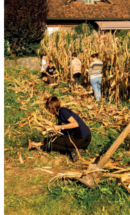
Acker räumen – Tüarggastroh schneiden.