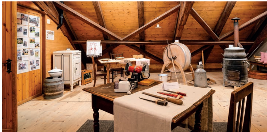
Einige mobile Kulturgüter sind in der Mühle ausgestellt.

Auch bei den immobilien Kulturgütern zeigt das Konzept, wo Handlungsbedarf besteht. Während die Pfrundbauten, Mühle, Hagenhaus und römischer Gutshof gut erschlossen sind, braucht es bei anderen Themen neue Lösungen: So soll etwa die Unterschutzstellung des Bahnhofs Nendeln erneut vorangetrieben und für den Widumstall geprüft werden, ob er künftig als Ort für die Weinbaukultur genutzt werden kann. Ergänzend sollen geschichtliche Orte wie die ehemalige Gerichtsstätte beim Rofaberg stärker sichtbar gemacht werden.