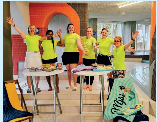
Wassertag, Hallenbad Eschen.

Unser Angebot reicht vom Babyschwimmen für die Kleinsten (ab 4 Monaten) über die Schwimmschule, Fit&Fun Kids und Juniors bis hin zu Erwachsenenschwimmen, Masters- und Triathlontraining. Wer lieber sanft im Wasser trainiert, findet bei uns mit Aquafitness das passende Angebot: schonend für die Gelenke, aber wirkungsvoll für Kraft, Beweglichkeit und Ausdauer, und das für Frauen und Männer jeden Alters, auch ohne Schwimmkenntnisse.