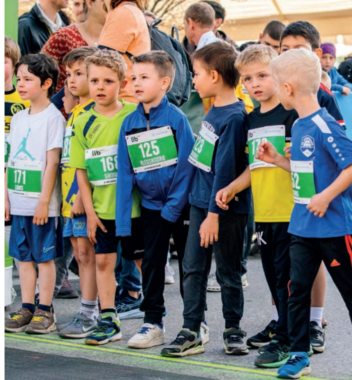
Bretschalauf am 25. April in Eschen.