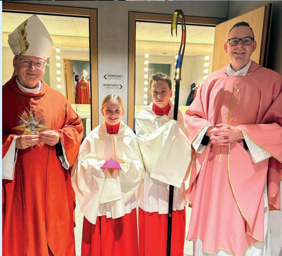
Text und Fotos: Pfarreirat Eschen-Nendeln

Grosse Freude herrschte in Nendeln aufgrund des seltenen Ereignis einer Altarweihe, die anlässlich der Renovierung der Kapelle St. Sebastian und Rochus vorgenommen wurde. Bischof Benno aus Feldkirch kam persönlich, um der Feier vorzustehen; umrahmt von vielen Ministranten und dem Männerchor Nendeln wurde der neue Altar gesalbt und mit einem Reliquienstein versehen.