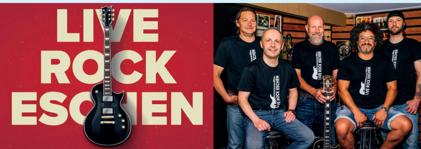
Die Gründungsmitglieder von LIVE ROCK ESCHEN: Gemeinsam für mehr Livemusik in der Gemeinde.