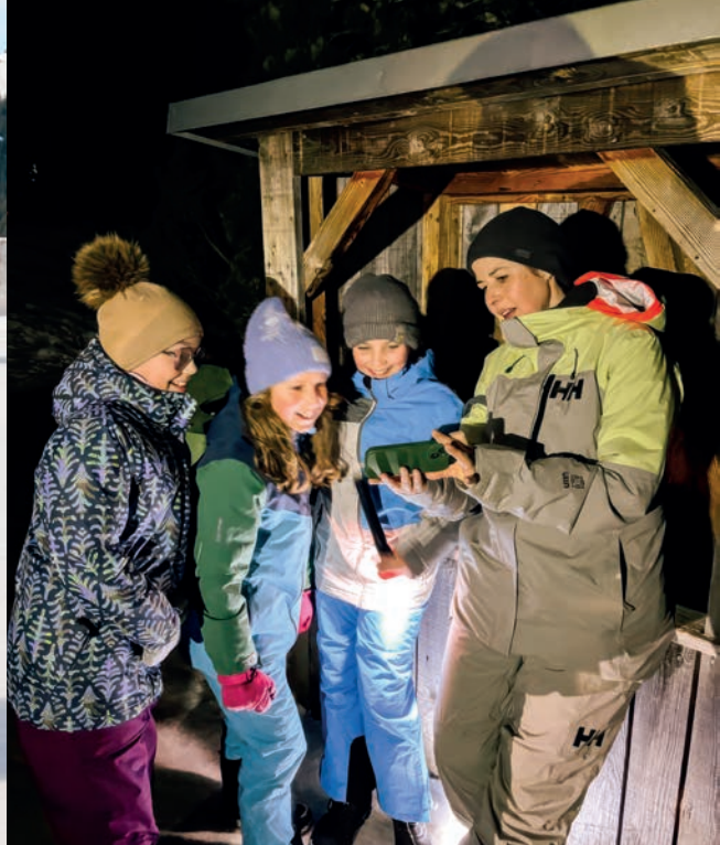
Wintersporttag Eschen / Winterlager 4. Klassen.