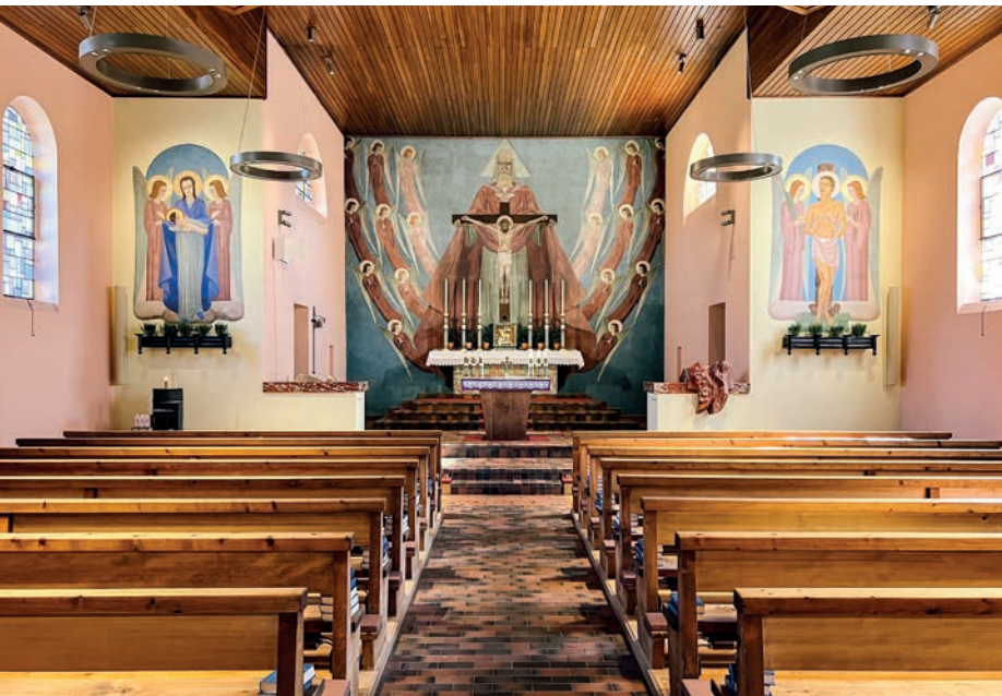
Innenansicht der frisch sanierten Kapelle. Die restaurierten Gemälde und die wiederhergestellte ursprüngliche Farbgebung lassen den Innenraum in neuem Glanz erscheinen.

Nach rund einjähriger Sanierungszeit konnten die Arbeiten an der denkmalgeschützten Kapelle St. Sebastian und Rochus in Nendeln erfolgreich abgeschlossen werden. Die Wiedereröffnung am 14. Dezember 2025 erfolgte im Rahmen einer feierlichen Messe und stiess auf grossen Anklang. Höhepunkt war die Weihe des neuen Altares durch Bischof Benno Elbs. Die Feier wurde musikalisch vom Männerchor Nendeln umrahmt und fand ihren stimmungsvollen Abschluss im Begegnungszentrum Clunia.