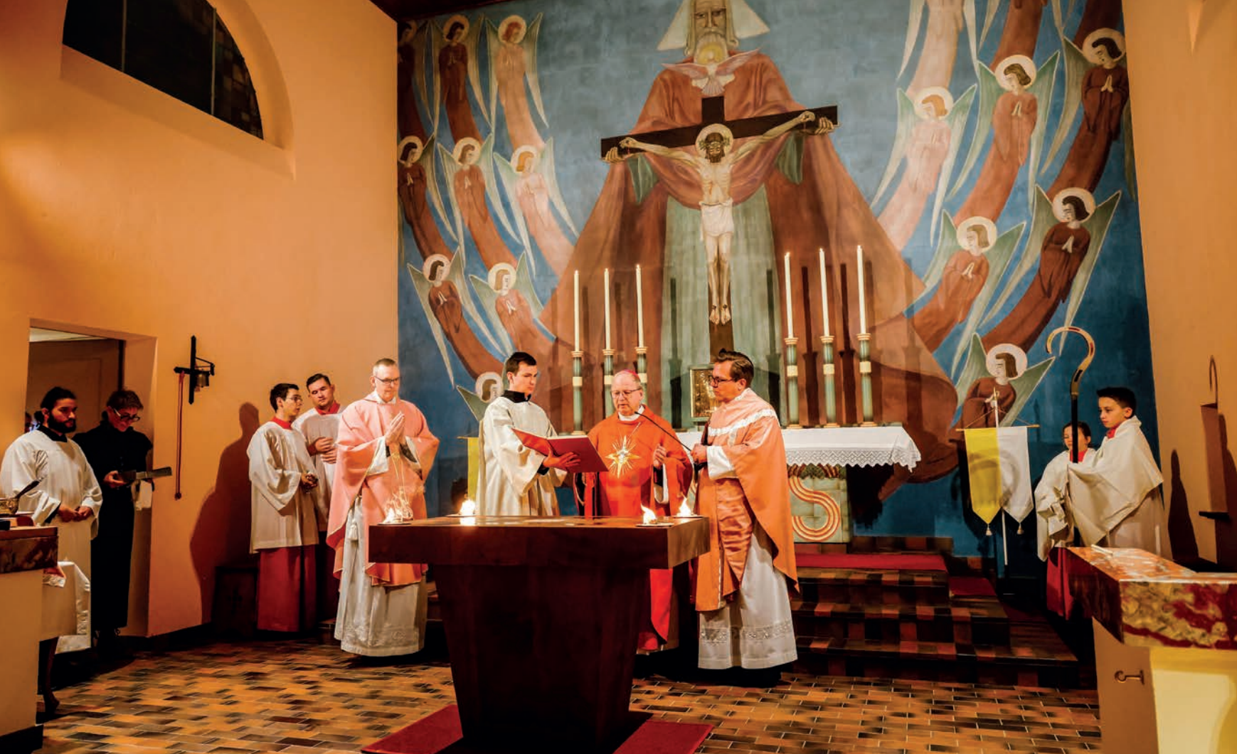
Bischof Benno Elbs bei der Altarweihe anlässlich der feierlichen Wiedereröffnung der sanierten Kapelle St. Sebastian und Rochus.