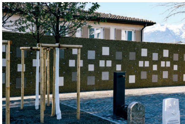
Blick auf die erweiterte Urnenwand an der Südseite des Friedhofs, die als Einfriedung dient und Raum für 71 zusätzliche Urnennischen bietet.