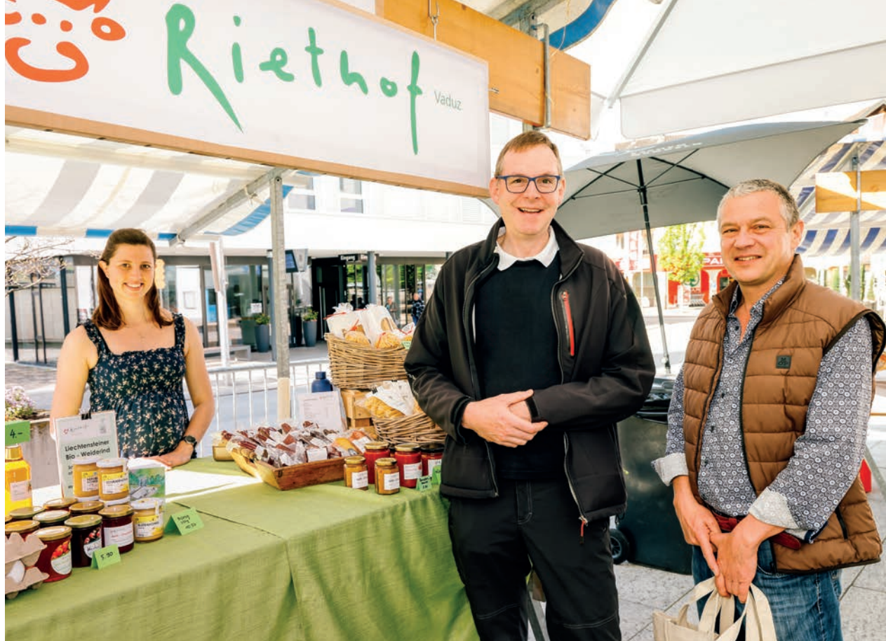
Die Bauernmarktsaison wurde eröffnet.