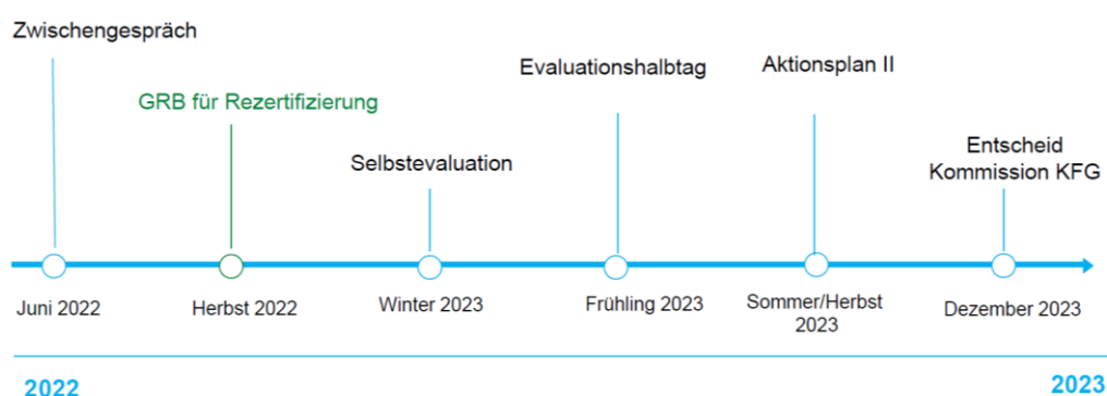
Abbildung: Weg der Rezertifizierung (Zeitstrahl mit Meilensteinen)

Der nächste Schritt, der für die Gemeinde auf dem Weg für eine Rezertifizierung ansteht, ist die Beschlussfassung im Gemeinderat. Es soll vom Gemeinderat die Zustimmung abgeholt werden, dass sich die Gemeinde Eschen-Nendeln als «Kinderfreundliche Gemeinde» rezertifizieren lassen möchte. Das weitere Vorgehen ist im Zeitstrahl mit den Meilensteinen festgehalten und wird nach einem befürwortenden GR-Beschluss angegangen.